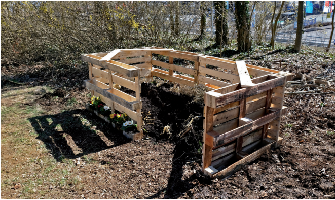
Einfach selbstgebaut: Ein Komposter aus Paletten.

Bioabfälle im eigenen Garten zu kompostieren, ist die älteste Recyclingmethode, die wir kennen. Denn die Verrottung von organischen Abfällen bildet die idealen Stoffkreisläufe in der Natur ab. Aus Küchen- und Gartenabfällen entsteht wertvoller Humus, der den Gartenboden verbessert und den Pflanzen Nährstoffe bietet. Wer Kompost als Gartendünger nutzt, erhält den Boden fruchtbar. Industrieller Dünger oder der ökologisch kritische Einsatz von Torf in Blumenerden ist damit überflüssig. Wer keinen Komposter hat, kann hochwertigen Kompost aus der Region auch beim Kompostwerk bekommen, z. B. beim Entsorgungszentrum Leppe in Lindlar-Remshagen. So schließen sich die Stoffkreisläufe nicht nur über die eigene Kompostierung im heimischen Garten, sondern auch über die Biotonne.