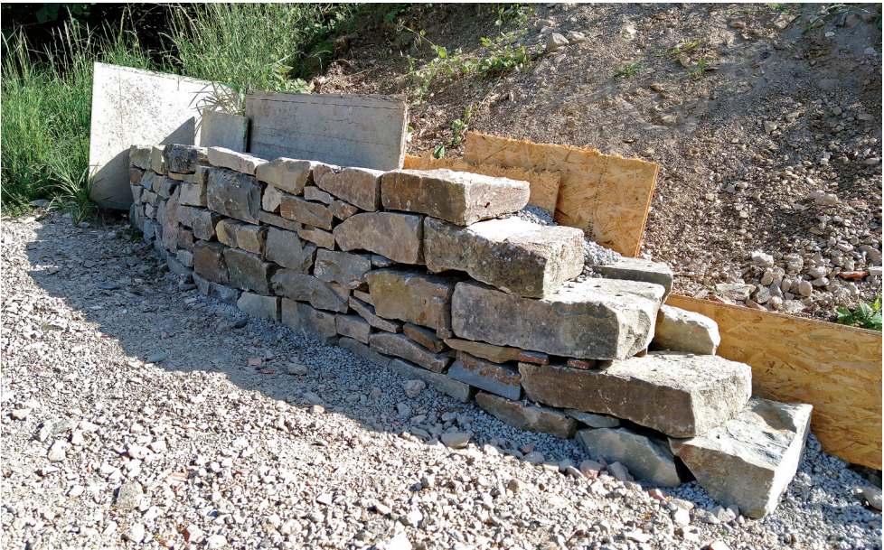
Die Trockenmauer auf dem Gelände der VHS Oberberg im Bau.