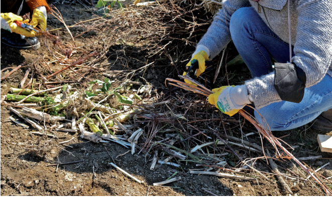
Große Pflanzenteile sollten vor dem Kompostieren zerkleinert werden.

Große Mengen eines einzigen Materials, z. B. Rasenschnitt, können zu Problemen auf dem Kompost führen. Eine gute Mischung der eingebrachten Reste ist wichtig. Feuchtes Material sollte mit trockenem und feinteiliger mit groben Strukturen vermischt werden. Hohlräume im Kompost ermöglichen, dass Luft nachströmt und die Bodenorganismen arbeiten können. Solche Hohlräume entstehen durch Hecken- und Gehölzschnitt oder Staudenstängel, die unter feines Material wie Rasenschnitt, Laub, Gemüsereste und Küchenabfälle gemischt werden. Damit Rasenschnitt gut verrottet, sollte er vor dem Kompostieren antrocknen, mit grobem Material gemischt und auseinandergezogen auf den Kompost aufgebracht werden.