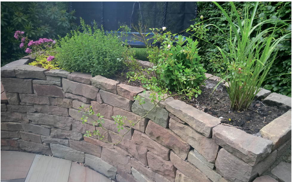
Trockenmauer als Einfassung eines kleinen Hochbeetes.

Eine detaillierte Anleitung für den Bau einer Trockenmauer findet sich in der Broschüre „Bienen, Blüten und Begegnung – Ein Leitfaden zur ökologischen Aufwertung von Dörfern“ die unter https://biostationoberberg.de/downloads.html kostenlos heruntergeladen werden kann.