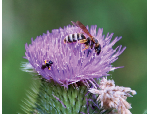
Auch die Ackerkratzdistel ist bei Wildbienen beliebt.

Winkel zur Holzfasern erfolgen, um Rissbildungen und ein Aufquellen der Fasern durch eindringende Feuchtigkeit zu vermeiden. Dabei sollten Holzbohrer von unterschiedlichen Durchmessern genutzt werden, bewährt haben sich hier ebenfalls vier bis acht mm. Der Mindestabstand zwischen den einzelnen Bohrungen sollte zwei cm nicht unterschreiten.