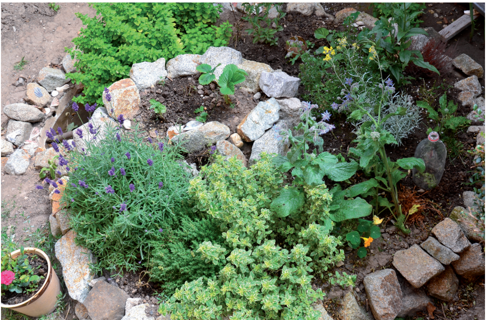
Kräuterspirale: Hübscher Blickfang und frische Kräuter auch für kleine Gärten.

Der Bau kann an die eigenen handwerklichen Fähigkeiten und Voraussetzungen angepasst werden. Für kleine Gärten oder Balkone bietet sich eine eher kompakt gehaltene Spirale an, die gerade Platz für die nötigsten Küchenkräuter vorhält. Wer mehr Fläche zur Verfügung hat, kann auf eine große Spirale mit vollem Sortiment und breiter Pflanzenauswahl setzen. Natürlich entscheiden nicht zuletzt die örtlichen Rahmenbedingungen darüber, wie viel Platz für den Bau zur Verfügung steht. Auch der ästhetische Aspekt sollte nicht zu kurz kommen, wirkt doch eine zu klein gebaute Spirale in einem großzügigen Garten eher verloren, oder eine überdimensionierte Version im Kleingarten ebenso fehl am Platze.