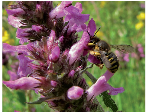
Eine Garten-Wollbiene sucht Nektar an Heil-Ziest.