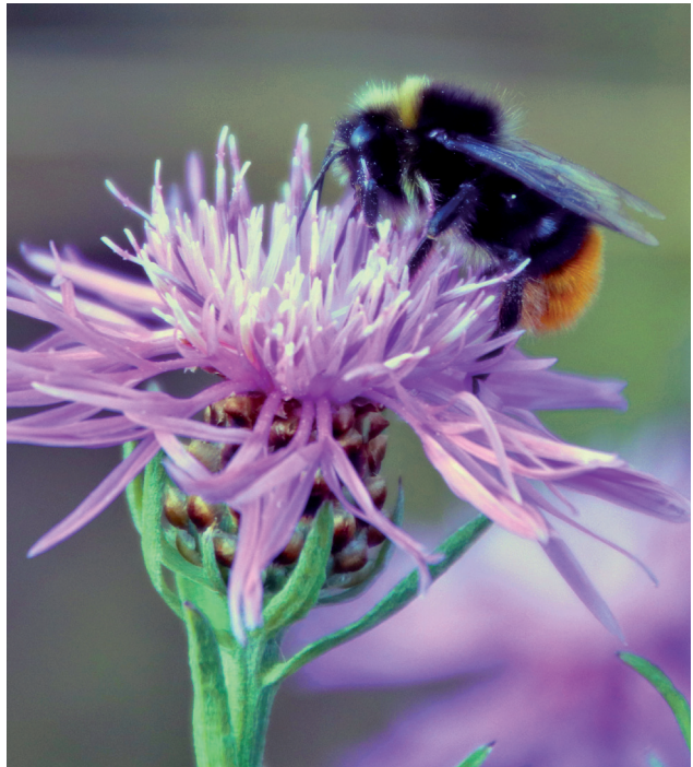
Wiesenhummel auf Wiesen-Flockenblume.

Albert Einstein soll einmal gesagt haben, dass, wenn die Bienen aussterben würden, auch die Menschheit dem Untergang geweiht sei. Dieses Urteil müsste eigentlich eher noch für die Hummel gelten. Denn die Hummelarten sind sogar noch „fleißigere“ Bestäuber als viele andere Wildbienenarten und die Honigbienen. Vielleicht dank ihrer Körperfülle fliegen sie schon bei 3 Grad Außentemperatur, Regen- oder Graupelschauern aus, um Blüten zu besuchen. Damit leisten Hummeln einen enormen Beitrag, damit Pflanzen Früchte hervorbringen können.