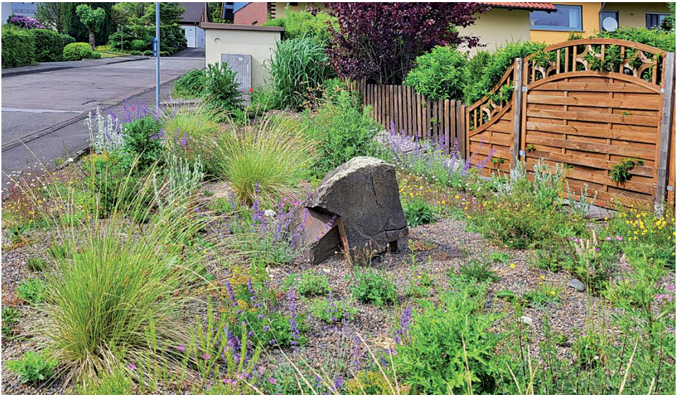
Das selbe Beet im Sommerkleid.

Eine detaillierte Checkliste zur Anlage von insektenfreundlichen Staudenbeeten findet sich in der Broschüre „Bienen, Blüten und Begegnung – Ein Leitfaden zur ökologischen Aufwertung von Dörfern“ die unter https://biostationoberberg.de/downloads.html kostenlos heruntergeladen werden kann.