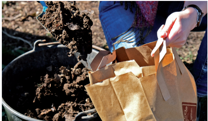
Jetzt ist er fertig: Feinkrümeliger Kompost.

In der Mitte des Kompostes laufen die Abbauprozesse aufgrund der höheren Temperaturen schneller ab. Durch das Umsetzen vermischen sich die verschiedenen Rottestufen und nach ungefähr einem Jahr ist der Kompost reif und kann im Garten eingesetzt werden.