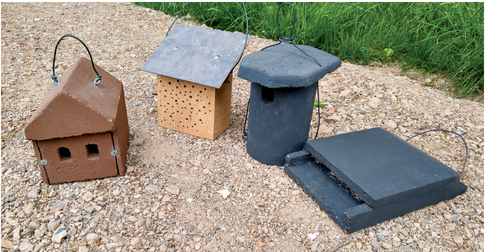
Verschiedene Nistkästen aus dem Gartenprojekt: v.l.n.r.: Nischenbrüter, Wildbienen, Höhlenbrüter, Fledermäuse.

Viele der heimischen Fledermäuse sind den Menschen in die Siedlungen und in die Kulturlandschaft gefolgt. Doch seitdem die Landschaft immer intensiver genutzt wird und Gebäude immer besser isoliert und saniert werden, bekommen Fledermäuse zunehmend Schwierigkeiten dabei, Wohnraum zu finden. Dazu kommt das Problem, dass durch das Insektensterben auch die Nahrung für Fledermäuse knapper wird.