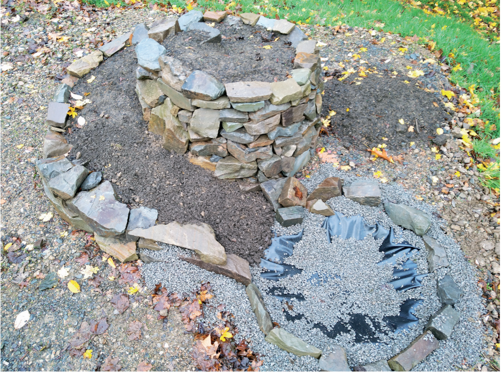
Die Kräuterspirale auf dem Gelände der VHS Oberberg - hier noch ohne Bepflanzung.

Was die Baumaterialien anbelangt, so hat man in weiten Grenzen vielfältige Auswahlmöglichkeiten an geeigneten Materialien. Lediglich frei von Schadstoffen sollten diese sein und eine gewisse Witterungsbeständigkeit aufweisen. So können beispielsweise wiederverwendete Baumaterialien zum Einsatz kommen. Gut geeignet sind Dachziegel aus Beton oder Ton, Mauersteine aus Beton, Kalksandstein oder der klassische Backsteinziegel als Grundmaterial. Ungeeignet sind Bimssteine, Leichtbeton oder Gasbeton-Bausteine. Sicherlich können auch diverse Plattenmaterialien oder Pflastersteine zweckentfremdet eingesetzt werden, unumstritten ist aber wohl ein Naturstein die beste Wahl. Dieser lässt sich nicht nur problemlos gestalterisch an die meisten Umgebungen anpassen, er bildet auch als eines der wenigen Baumaterialien ein schadstofffreies, unkompliziertes Umfeld für jegliche Bepflanzungen.