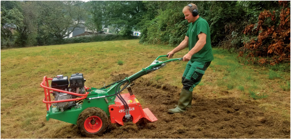
Eine sogenannte Umkehrfräse erleichtert die Vorbereitung des Saatbettes.

festgedrückt werden. Anschließend sollte die Fläche für zwei bis drei Wochen feucht gehalten werden.