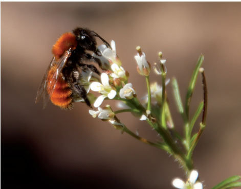
Die Wildbiene „Fuchsrote Sandbiene“ an Behaartem Schaumkraut.

Eine andere Möglichkeit besteht darin, etwa zehn cm tiefe und parallel zueinander liegende Löcher in Holzblöcke oder Stammabschnitte aus trockenem Hartholz (z. B. Esche, Eiche oder Apfelbaum) zu bohren. Die Bohrungen müssen dabei von einer Seite aus im rechten