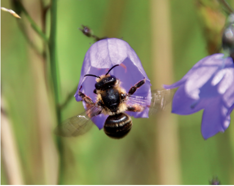
Hier hat eine Glockenblume Besuch von einer Wildbiene.