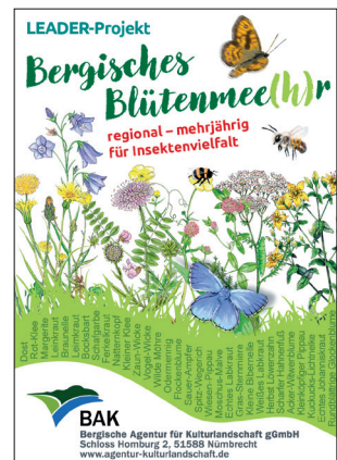
Das „Bergische Blütenmee(h)r“: Beispiel einer regionalen Blümmischung für das Bergische Land.

Hat sich die Blumenwiese etabliert, muss sie gepflegt werden. Das betrifft auch mehrjährige Blumenwiesen. Die Flächen sollten ein bis zwei Mal im Jahr gemäht und das Mahdgut abgetragen werden. Der früheste Schnitt sollte dabei erst ab Mitte Juni erfolgen. Je nach Zuwachs kann dann nochmal Ende August bzw. im September gemäht werden. Es ist empfehlenswert, immer einen Teilbereich des Aufwuchses stehen zu lassen. Auf diese Weise haben Insekten auf der Fläche einen Rückzugsort und in den Stängeln nistende Tiere werden geschont. Die stehen gelassenen Teilbereiche können dann bei der Mahd im Folgejahr mit gemäht werden. Bei dieser Mahd wird dann ein anderer Teilbereich stehen gelassen.