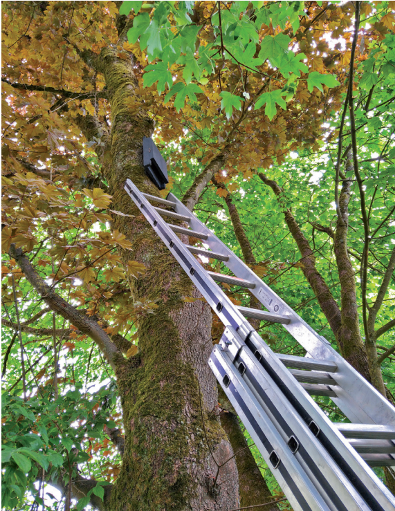
Vier bis fünf Meter hoch aufgehängt bietet ein Flachkasten Fledermäusen ein sicheres Quartier.

Es können mehrere Kästen in kleinen Gruppen am Gebäude oder an Bäumen montiert werden. Dabei sollten Sie diese am besten in verschiedene Himmelsrichtungen ausrichten.