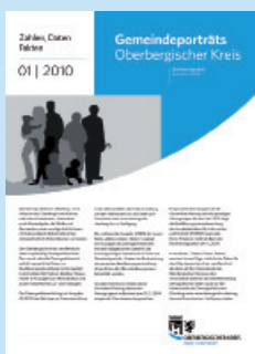
Zahlen, Daten, Fakten Ausgabe 1/2010 Gemeindeporträts Oberbergischer Kreis