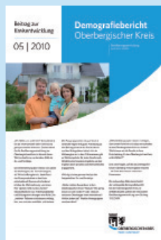
Beitrag zur Kreisentwicklung Ausgabe 5/2010 Demografiebericht Oberbergischer Kreis